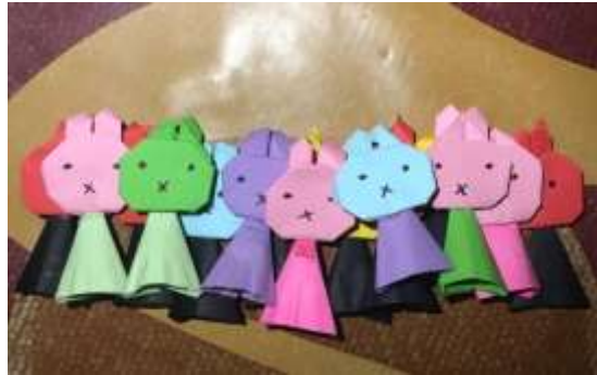
Gambar 3. Boneka Jari

membantu anak-anak (usia 5–6 tahun) merasa lebih nyaman dengan diri mereka sendiri.