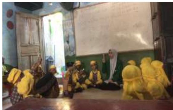
Gambar 4. Bermain boneka jari dengan duduk melingkar