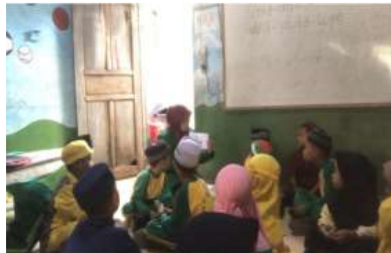
Gambar 5. Bermain boneka jari dengan berkelompok

Pada tahap pra siklus, sebagian besar anak berada pada kategori Belum Berkembang (67%) dan Mulai Berkembang (33%). Hal ini menunjukkan bahwa rasa percaya diri anak masih rendah, yang ditandai dengan kurangnya keberanian anak untuk tampil, berbicara, dan berinteraksi. Oleh karena itu, anak membutuhkan stimulus pembelajaran yang menarik agar berani tampil dan percaya diri (Alifia et al., 2026). Selain itu, kurangnya media pembelajaran yang interaktif menyebabkan