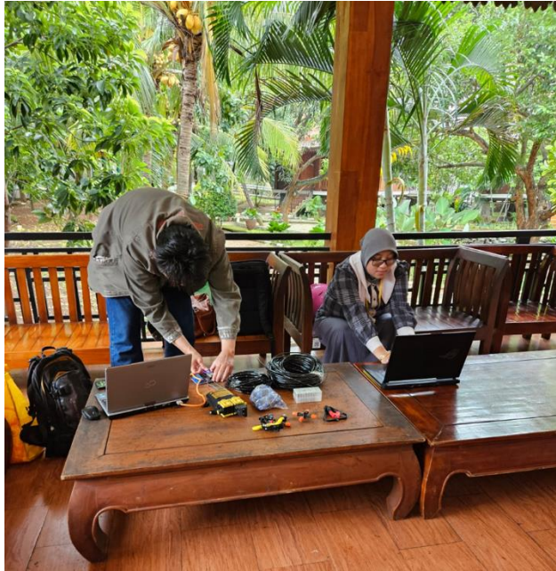
Gambar 2. Demonstrasi cara penggunaan alat penyiraman tanaman otomatis