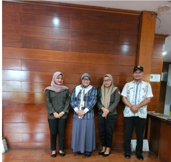
Gambar 3. Peserta pelatihan alat penyiraman tanaman otomatis

Kegiatan pengabdian kepada masyarakat di kawasan wisata budaya ini berjalan dengan lancar dan memberikan dampak positif meski dalam skala yang sederhana. Program ini berfokus pada pelatihan penggunaan teknologi berbasis IoT untuk pembuatan alat penyiram tanaman otomatis, dengan tujuan untuk membantu mempermudah perawatan tanaman di kawasan wisata. Meskipun teknologi yang digunakan cukup sederhana, pelatihan ini memberikan wawasan baru bagi peserta mengenai cara menggunakan teknologi untuk mempermudah pekerjaan sehari-hari, terutama dalam hal perawatan tanaman. Saat alat penyiram otomatis diuji coba di lapangan, alat ini dapat berfungsi sesuai yang diharapkan, dengan menyiram tanaman berdasarkan tingkat kelembapan tanah. Penggunaan alat ini membantu mengurangi pekerjaan manual dalam penyiraman, meskipun penerapannya masih terbatas pada area kecil. Beberapa tantangan teknis muncul selama proses implementasi, namun peserta berhasil mengatasi masalah tersebut dengan bimbingan dari tim dosen. Kegiatan ini juga menjadi ajang bagi peserta untuk berdiskusi dan berbagi pengalaman. Meski ada kesulitan teknis di beberapa bagian, peserta menunjukkan semangat belajar yang tinggi dan mampu menyelesaikan permasalahan yang muncul. Pendampingan yang diberikan tim dosen membantu peserta lebih memahami cara kerja alat dan cara memanfaatkannya dengan optimal.