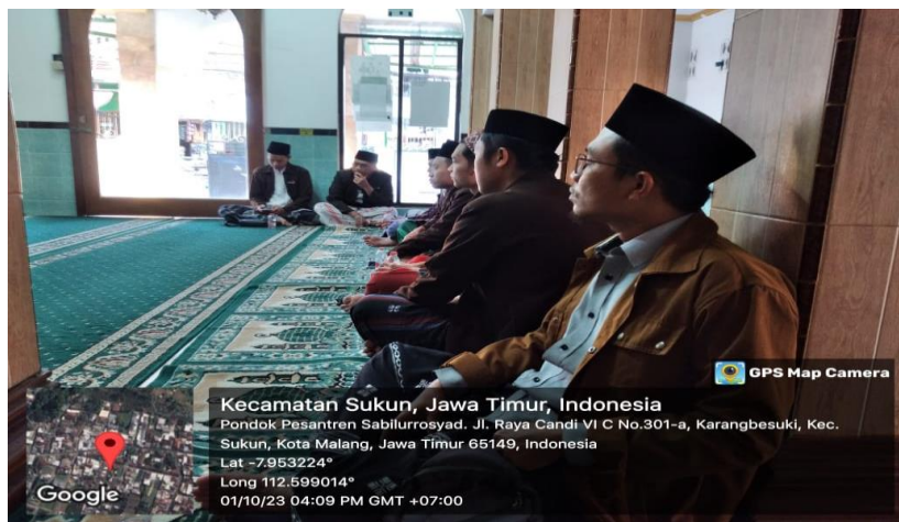
Gambar 5. Para peserta FGD penguatan moderasi beragama