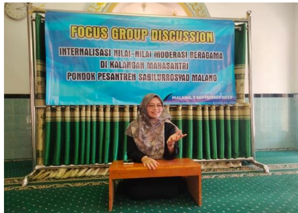
Gambar 2. Narasumber menyampaikan materi tentang nilai moderasi