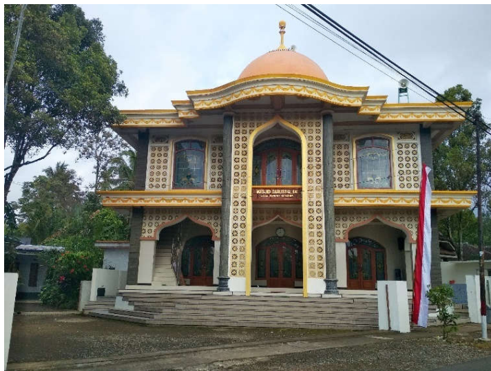
Gambar 1 Masjid Darussalam tampak depan

Pelaksanaan pengabdian masyarakat melalui kegiatan kuliah kerjanya (KKN) ini dilaksanakan di Masjid DARUSSALAM dusun Sragi tengah Desa Sragi, masjid ini awalnya dari musholla kecil atau surau panggung yang didirikan oleh KH Abdurrohim dari Kediri, Putra dari kyai burhanudin Kediri. Mempunyai tujuan untuk menyebarkan agama islam. Berkembang membuat masjid, tetapi tidak sebgas masjid lain. Masjid Darussalam menjadi panutan masjid lain, karena adanya kyai sepuh Abdurrohim. Masyarakat mengusulkan untuk membangun masjid lebih modern, namun terhalang dengan ketakutan masyarakat tentang tanah waqaf. Sehingga muncullah usulan untuk mengadakan musyawarah dengan mengumpulkan semua ta'mir masjid hitam diatas putih untuk masalah waqaf. Sebelum melaksanakan pembangunan kyai Abdurrohim soan ke salahsatu Alm kyai sepuh glenmore, untuk meminta amalan agar ketika pembangunan tidak membani semua masyarakat. Mengumumkan ke semua masyarakat di sekitar masjid Darussalam bahwasannya akan dilakasnakan pembangunan masjid. Dan bagi masyarakat yang ingin menyumbang seikhlasnya. Setelah diumumkan semua masyarakat mempunyai inisiatif untuk gotongroyong dalam pembangunan masjid. Seperti, satu warga membawa batu, pasir, semen, kayu, keramik itu adalah pembangunan masjid, proses pembangunannya berjalan pelan-pelan ,sehingga berdirilah masjid darussalam. Sehingga masjid Darussalam sudah di renovasi sebanyak 3 kali.