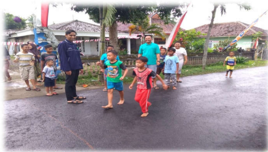
Perlombaan Sendok Kelereng