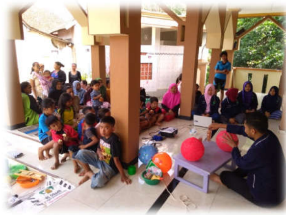
Proses pembuatan lampion