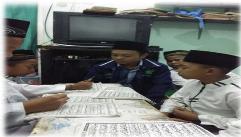
Kegiatan TPQ di malam hari

Setiap minggu, jamaah tahlil putra dan putri memiliki jadwal untuk melaksanakan kegiatan ini. Jamaah putra dan putri melaksanakan tahlil sekali dalam seminggu, yaitu pada Kamis malam. Sedangkan jamaah putri melaksanakan pada minggu malam. Tempat pelaksanaan tahlil mingguan ini digilir di rumah warga.