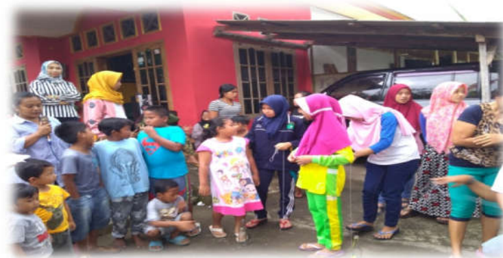
Pelaksanaan kegiatan lomba 17 agustus di lingkungan posdaya