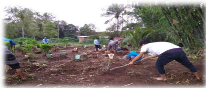
Permembersihan tanah wakaf bersama remas

Kegiatan ini dilaksanakan karena tidak terawatnya lahan wakaf di lingkungan sekitar makam, kegiatan ini juga akan menjadi rutinitas bagi remaja masjid setiap minggu ke 2 setiap bulannya. Hal-hal yang dilakukan adalah membersihkan tanaman liar dan menyapu di sekitar makam.