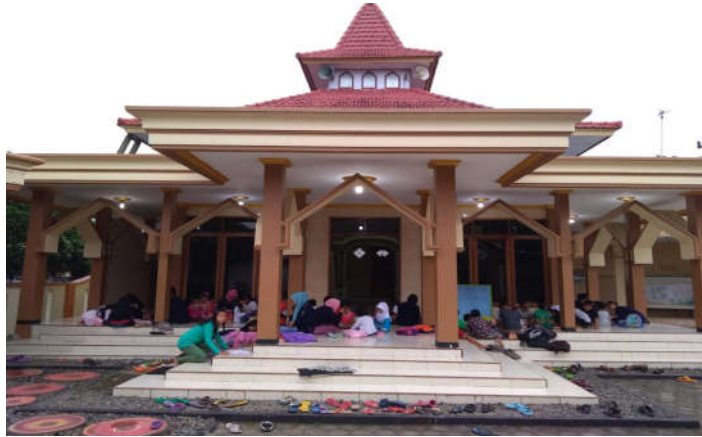
Gambar 1 Masjid Al Hadi Tampak Dari Depan

Sejarah singkat berdirinya “Masjid Al Hadi” , sebelum masjid ini dibangun dan berdiri berstatus Mushola. Mushola tersebut awalnya mushola pribadi yang didirikan dengan dana pribadi oleh H. Abdul Hadi. Selang beberapa tahun mushola tersebut direnovasi oleh pendiri juga masyarakat Kampung Anyar untuk dijadikan ibadah bersama. Sebelum masjid ini dibangun warga masyarakat Kampung Anyar mengeluh karena setiap satu minggu sekali yaitu pada hari jum’at bapak-bapak mengeluh dikarenakan masjid untuk melaksanakan sholat jum’at jauh dari desa mereka dan warga masyarakat Kampung Anyar sepakat untuk membangun serta merombak bangunan mushola tersebut untuk di rubah menjadi masjid.