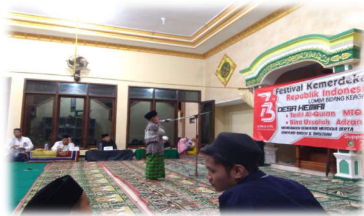
Pelaksanaan kegiatan lomba adzan