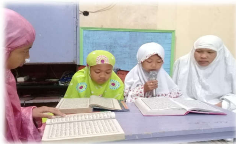
Tadarus Al-Qur'an di Masjid Al-Hadi

juga di undang di beberapa tempat ketika ada acara-acara tertentu. Peserta KKN ikut serta mengikuti kegiatan hadrah untuk lebih memeriahkan dengan ikut membaca syair-syair sholawat.