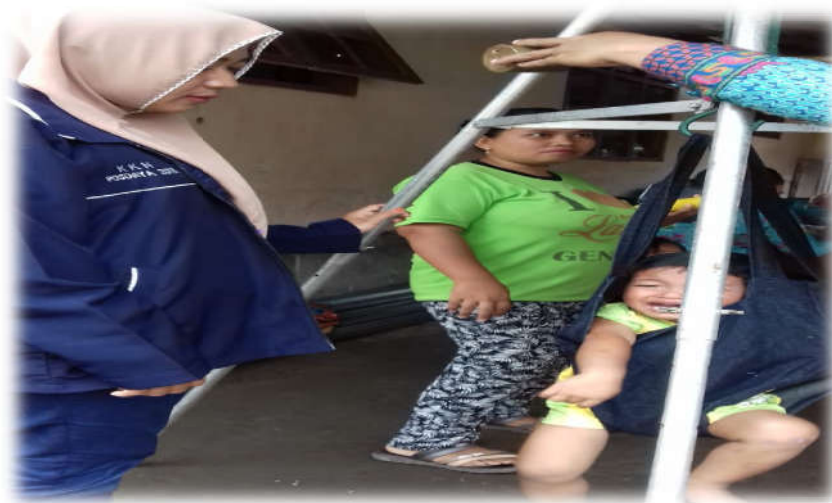
“Penimbangan Berat Badan”