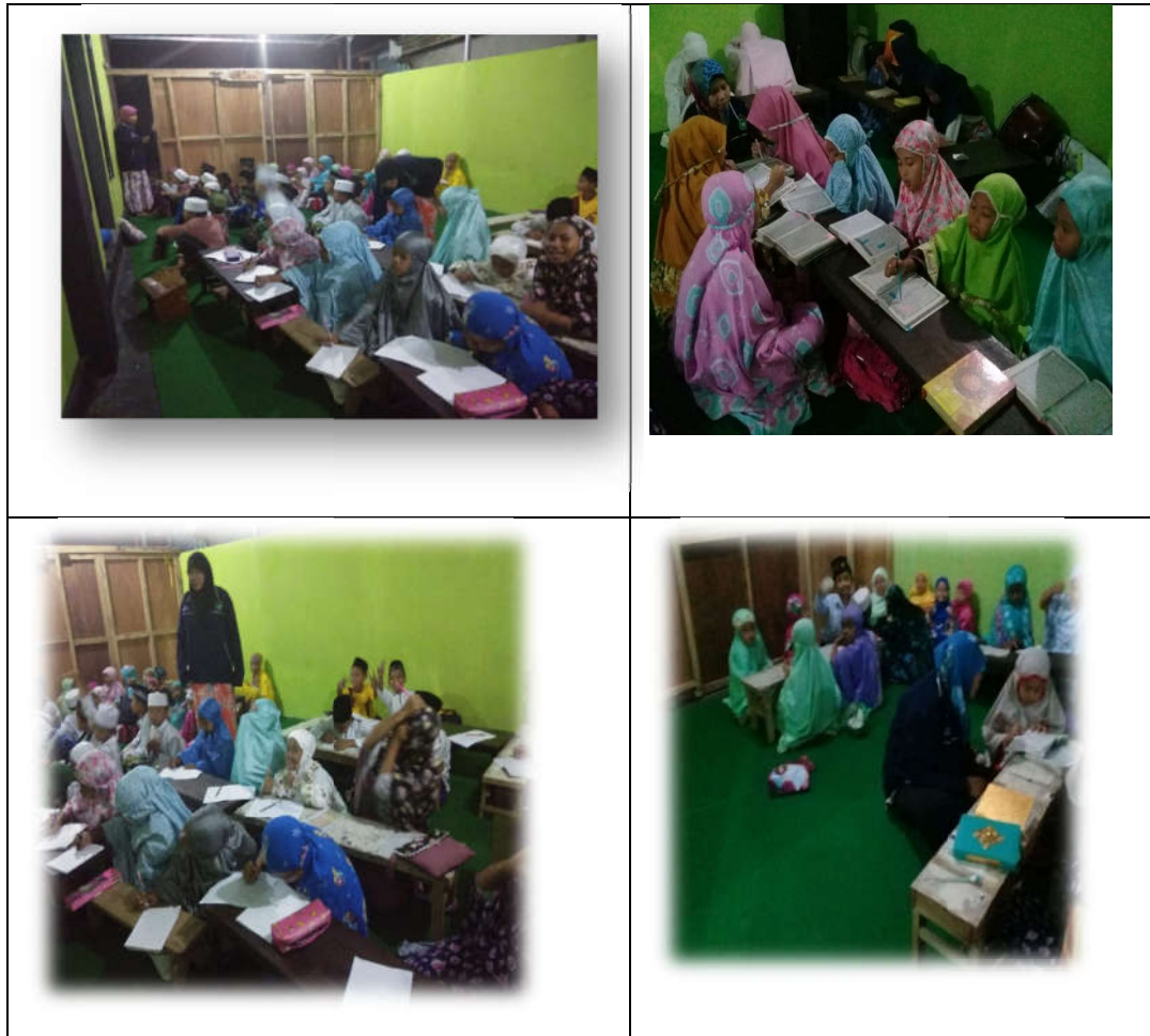
Pembelajaran TPQ berlangsung