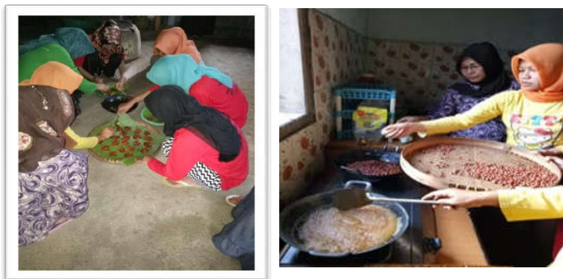
Gambar 3 Pelatihan Pembuatan Ampyang

Salah satu program posdaya berkah adalah pelatihan pembuatan ampyang. Pembuatan ampyang yang bahan utamanya adalah gula merah, kacang tanah, jahe parut perasan airnya, air putih. Ide ini muncul karena dusun Seneposari mayoritas penduduknya adalah produsen gula merah. Selain pelatihan pembuatan Ampyang ada program Bank sampah yang menjadi program unggulan bidang ini, karena hasil sampah yang dikumpulkan dari rumah-rumah warga dijual dan uang tersebut memiliki fungsi charity .