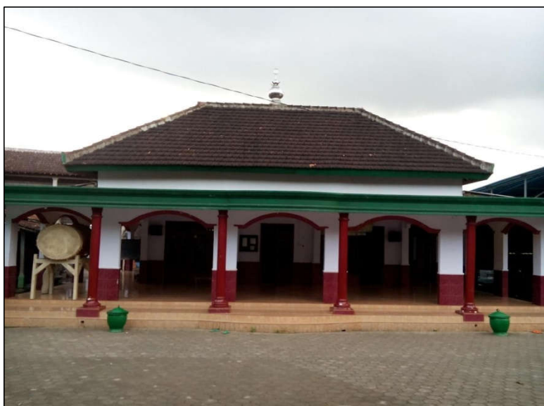
Gambar 1 Masjid Baitul Mu'minintampak depan

Pelaksanaan pengabdian masyarakat melalui kegiatan kuliah kerja nyata (KKN) ini dilaksanakan di Masjid Baitul Mu'minin terletak di Desa Seneposari Kecamatan Siliragung Kabupaten Banyuwangi. Masjid Baitul Mu'minin merupakan masjid dusun yang letaknya berjarak kurang lebih 10 km dari pusat kota. Bentuk dan fisik masjid Baitul Mu'minin baik. Masjid Baitul Mu'minin memiliki pasokan air yang lancar karena berasal langsung dari sumur yang dilengkapi pompa air dan bak penampungan yang disalurkan melalui pipa air secara langsung. Kelengkapan masjid juga sudah cukup memadai.