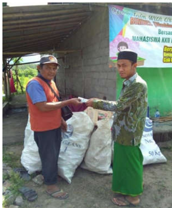
Gambar 4. Penjualan Bank Sampah ke Pengepul

Program posdaya ini dilakukan untuk membantu memperindah dan memanfaatkan lingkungan disekitar masjid Baitul Mu'minin (POSDAYA BERKAH), program ini juga bisa dilanjutkan setelah mahasiswa KKN selesai sehingga warga tetap memanfaatkan lahan kosong sebagai lahan sedia sayur dan keindahan lingkungan terjaga.