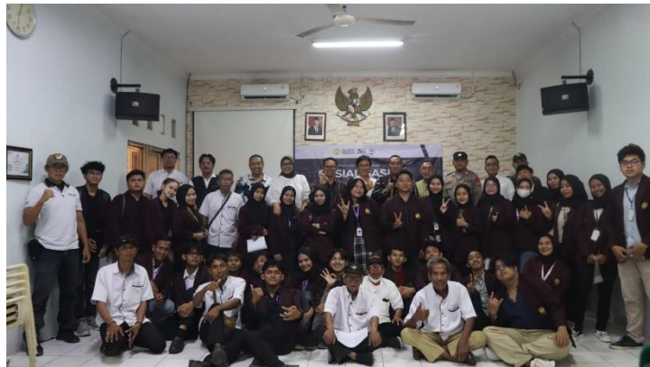
Gambar 4. Sesi Dokumentasi bersama Narasumber

Lebih lanjut, dalam Putusan Mahkamah Agung Nomor 489 K/AG/2011, kedudukan anak angkat dan anak tiri dapat dimasukkan dalam kelompok ashabah sababiyyah karena terdapat " illat (kausa hukum) yang sama dengan konsep al-wala ." Proses pemerdekaan dari perbudakan antara tuan dan bekas budaknya mungkin disebabkan oleh rasa kasih sayang dan kedekatan yang ada antara mereka. Sangat mirip dengan hubungan yang ada antara anak angkat dan orang tua angkatnya (Pahroji, 2019).