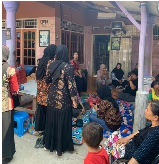
Gambar 5. Situasi Pendampingan dan Sosialisasi kepada UMKM Desa Cilamaya

Generasi Unggul dalam Transformasi Digital Desa” juga diberikan kepada masyarakat UMKM Desa Cilamaya Kabupaten Karawang.