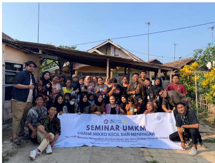
Gambar 6. Dokumentasi pasca Pendampingan dan Sosialisasi kepada UMKM Desa Cilamaya